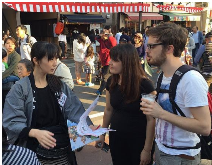
▲積極的に声をかけて、「川越まつり」の見どころを紹介